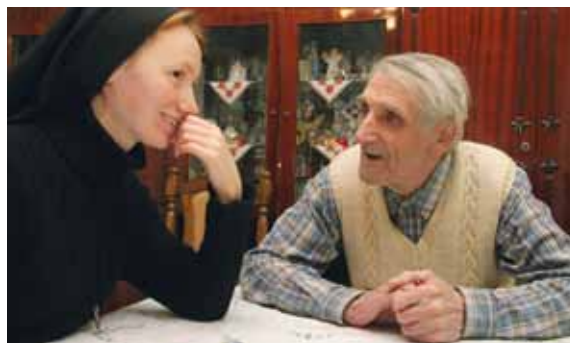
Ordensleute und Priester – unverzichtbar für die seelsorgliche und soziale Arbeit mit Menschen im Osten Europas