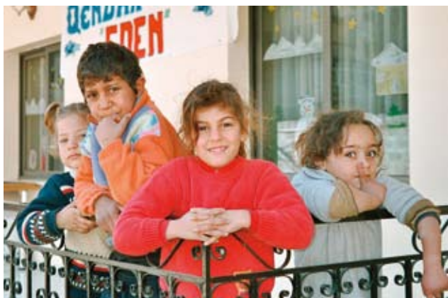
Албания: содействие беспризорным детям в Центре «Еден» в Тиране.

Проекты организации «Реновабис», осуществляемые в странах Центральной, Восточной и Юго-Восточной Европы, разрабатываются в тесном согласовании с партнерами на местах и поэтому они ориентируются на их нужды и возможности.