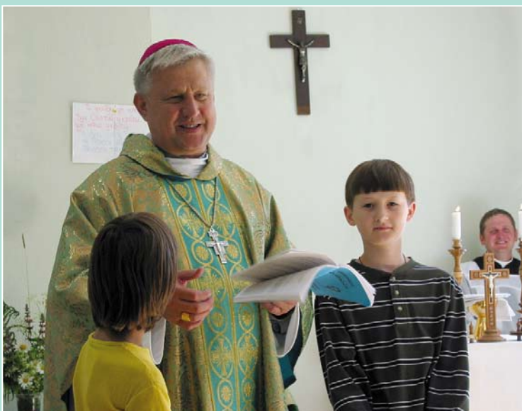
Damit Kinder von Gott erfahren

Wenn Sie sich mit Ihrem Unternehmen oder Förderverein engagieren wollen, berichten wir Ihnen auch gerne in Ihren Räumlichkeiten von unserer Arbeit. Durch dieses Angebot können sich Förderer einen guten Eindruck verschaffen, wo in den osteuropäischen Ländern Menschen unsere Unterstützung brauchen und wie Renovabis sich mit seinen Projekten vor Ort engagiert.