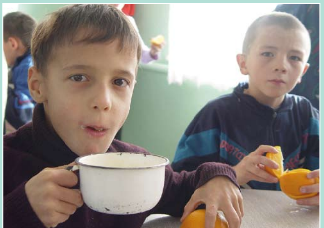
Damit Not gelindert wird

Verfügt eine Treuhandstiftung beispielsweise über ein Grundstockvermögen von 50.000 Euro, hat sie bei einer Verzinsung von vier Prozent einen jährlichen Zinsertrag von 2.000 Euro. Von diesen Einkünften werden lediglich drei Prozent, also 60 Euro, als Verwaltungsgebühr erhoben.