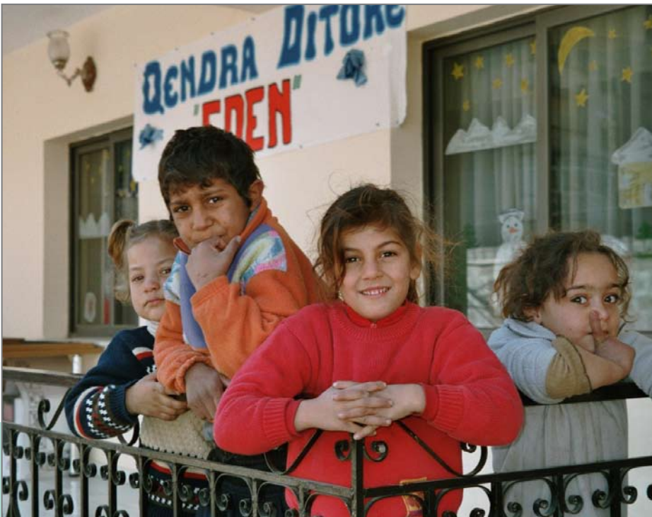
Endlich eine Chance auf Zukunft: Kinder in einem Straßenkinder-Zentrum in Albanien