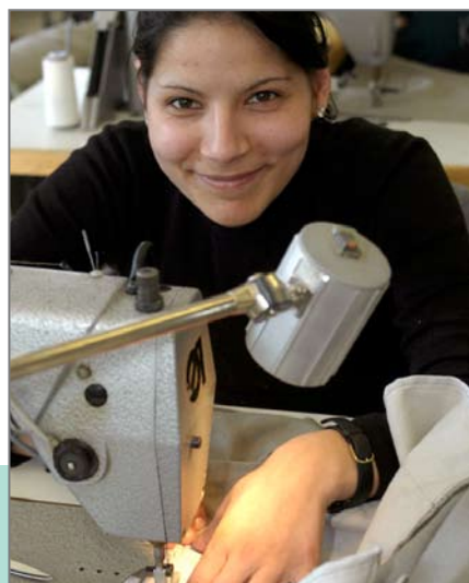
Hilfe zur Selbsthilfe – Ausbildung in einem Renovabis-Projekt

Viele Stifter möchten ihr privates oder berufliches Umfeld in ihr Engagement einbinden und eine Spendenaktion organisieren. Privatpersonen sammeln häufig bei Geburtstagen, Taufen, Familientreffen, Hochzeiten oder Trauerfeiern. Unternehmen bitten Lieferanten, Mitarbeiter oder Kunden um Spenden. Wenn Sie es wünschen, unterstützen wir Ihre Spendenaktion mit individuellen Spendenfaltblättern.