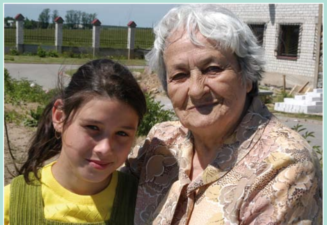
Einander Halt sein – über Generationen hinweg

Wenn Sie alle wichtigen Fakten für die Erstellung eines Testaments nachlesen möchten, schicken wir Ihnen gerne unsere kostenlose Broschüre „Wege in die Zukunft“ zu. Hier finden Sie viele wichtige Informationen zu den Themen Erbschaft, Vermächtnis und Testament. Mit praxisnahen Beispielen zeigt die Broschüre Ihnen verschiedene Möglichkeiten der Testamentsgestaltung auf.