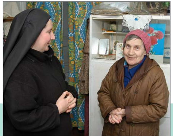
Menschliche Nähe für alte und bedürftige Menschen

Die einfachste Form des Stiftens ist die Zustiftung. Im Gegensatz zu einer eigenen Stiftung sind bei einer Zustiftung die behördliche Anerkennung und eine gesonderte Stiftungsverwaltung nicht erforderlich. Eine Zustiftung in die Renovabis-Stiftung ist bereits ab einem Betrag von 1.000 Euro sinnvoll.