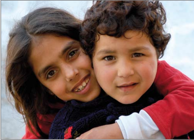
Dankbar für Zuwendung: elternlose Kinder in Mittel-, Ost- und Südosteuropa