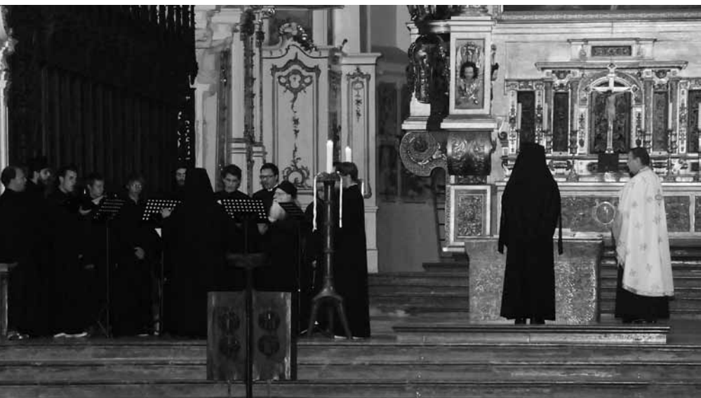
Vesper im byzantinischen Ritus im Freisinger Dom